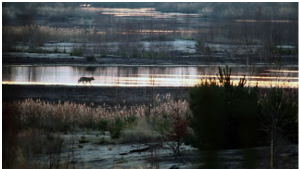
Wolf in der Morgendämmerung

Besprechung und Infos plus Kinotour nach dem Jump Break!