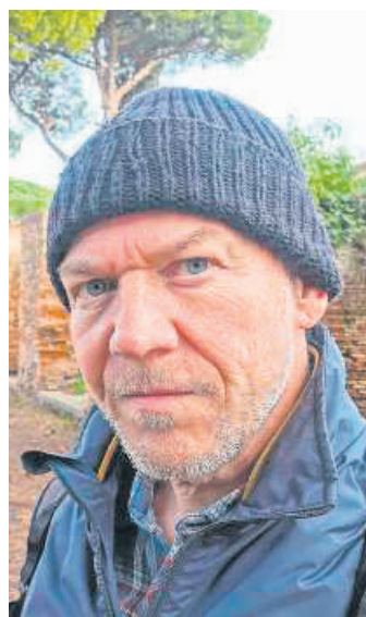
«Es gibt kein Pro und Kontra in dieser Frage»: Regisseur Horat.

Tollwut, die in der Schweiz als ausgerottet gilt, die Fütterung der Wölfe oder ein Mangel an Beute, also an Wild. Zwar ist der Dreh- und Angelpunkt in der Wolfsdebatte die menschliche Urangst vor der Bestie. Doch der Widerstand