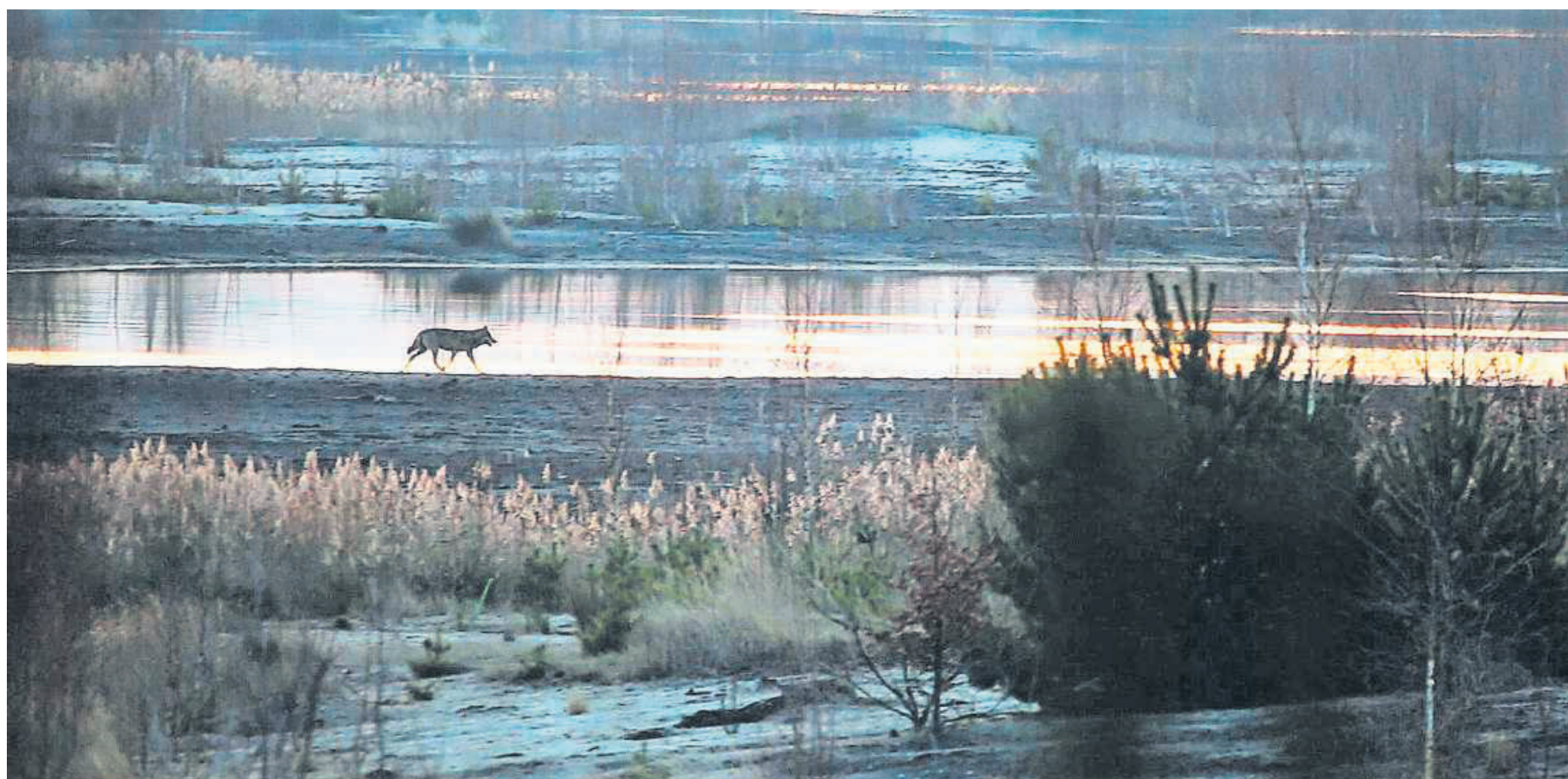
Seltene Aufnahmen, wie auf diesem Bild aus der Lausitz in Deutschland. In «Die Rückkehr der Wölfe» gibt es mehrere davon, auch spektakuläre.

Dieser Zwiespalt prägt denn auch die Wolfsdebatte in der Schweiz: Auf der einen Seite steht die wichtige Rolle, die der Wolf in der Natur einnimmt, weil er mit seiner Jagd auf Rotwild den Wald schützt. Auf der anderen Seite fürchten wir uns, wie Rotkäppchen gefressen zu werden. Zwar liegt dieses Risiko in Europa und Nordamerika nahe bei null. Doch das Restrisi-