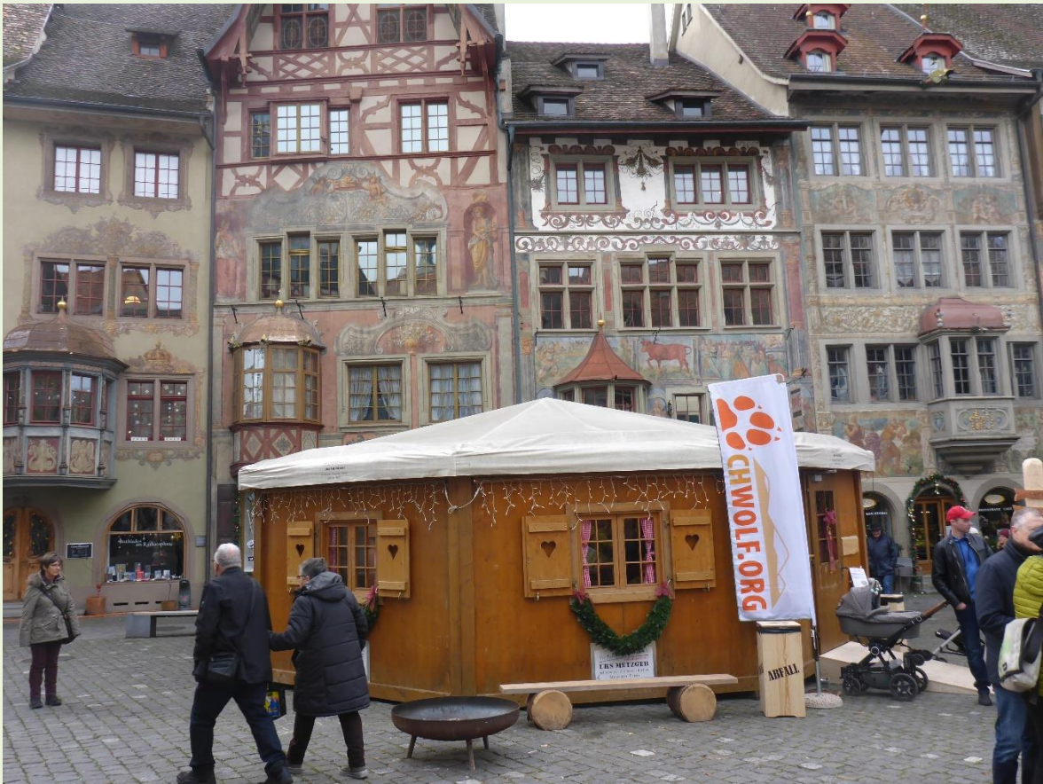
Märlihuus in der Märlistadt Stein am Rhein