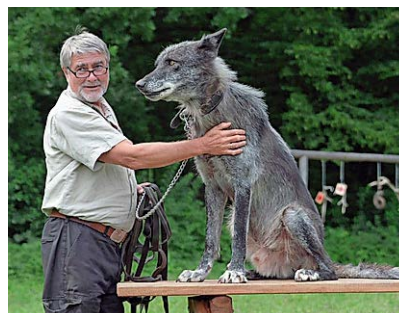
Im Wolf Science Center in Ernstbrunn (A) wird das Verhalten von Wölfen erforscht.

Die Biologin zeigt es in der kanadischen Wildnis: Mit dem Wolf lässt sich leben.