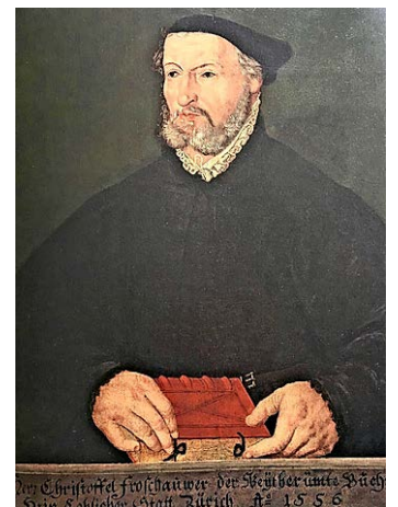
Der Bayer Christoph Froschauer erhielt am 9. November 1519 das Bürgerrecht der Stadt Zürich.

Da der bayerische Immigrant und Druckereigründer Christoph