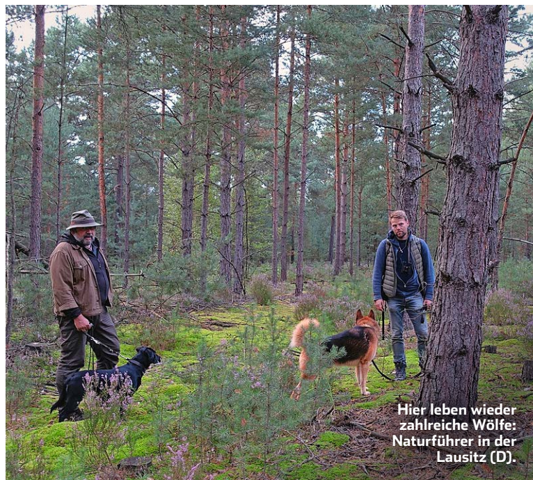
Hier leben wieder zahlreiche Wölfe: Naturführer in der Lausitz (D).